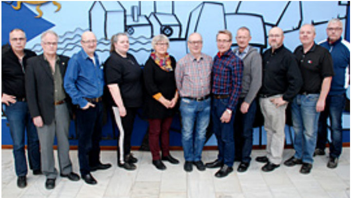
Några av demokratiberedningens ledamöter